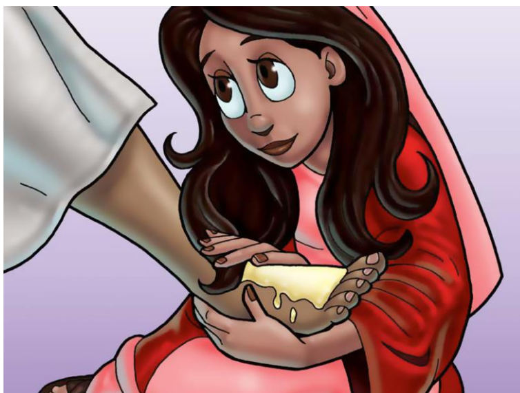
Illustrasjon: Nancy Cunningham

Maria salvet Jesus for å vise ham ære. Vi kan bruke ordene våre til å prise Han!